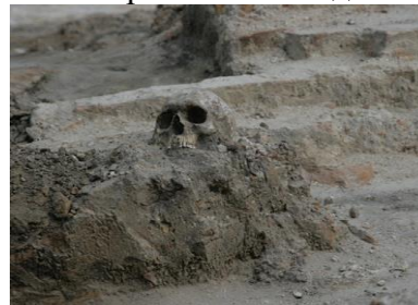
(Під час розкопок на місці трагедії, середина 2000-х)

Зрадив нас полковник Іван Нос, який показав російським військам таємний підземний хід. 2 листопада 1708 року місто було спалене, а його мешканці, навіть немовлята, знищені. Трупи старшин прибили цвяхами до дошок і кидали у річку, щоб налякати українське населення і щоб воно знало, що Батурин Зруйнований. Уся артилерія Мазепи – більше 40 гармат, - його прапори, відзнаки і всі дорогоцінності потрапили до рук Меншикова.