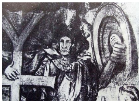
Гетьман Мазепа на гравюрі Данила Гала(1708р.)

У 1708р. Карл XII вирішив повернути в Україну, сподіваючись забезпечити свою армію провіантом, зміцнити її потугу козацькими полками та військом Лещинського. Зміна планів Карла XII (до цього похід мав відбутися в напрямку на Смоленськ і на Москву через територію Литви та Білорусі) виявилася несподіванкою для Мазепи. 24 жовтня 1708 року Іван Мазепа виїхав на зустріч із Карлом XII разом зі своїм вірним військом, зі своїми однодумцями, тобто своїм народом.