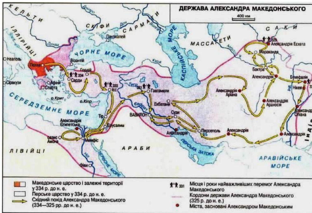
Східний похід Александра Македонського

Вчитель, користуючись матеріалами підручника (Бандровський О.Г., Власов В.С. Всесвітня історія. Історія України: підручник для 6 кл. – К.: Генеза, 2014. – 184-189 с.) та додатковою інформацією, використовуючи презентацію, описує перебіг подій 334-331рр. до н. е. та показує на карті напрями походів армії Македонського, місця визначних битв, територію підкорених країн.