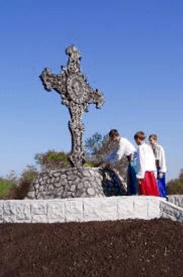
тактику Дійона це козак