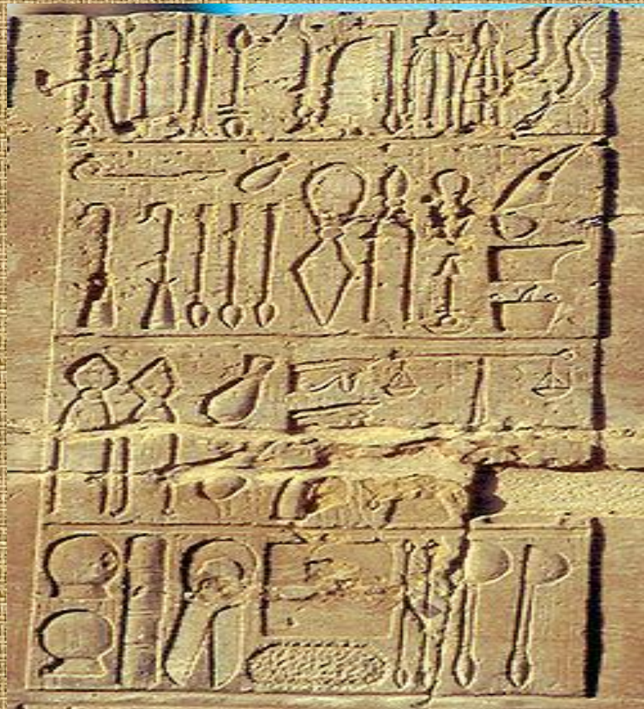
Стародавні єгипетські медичні інструменти