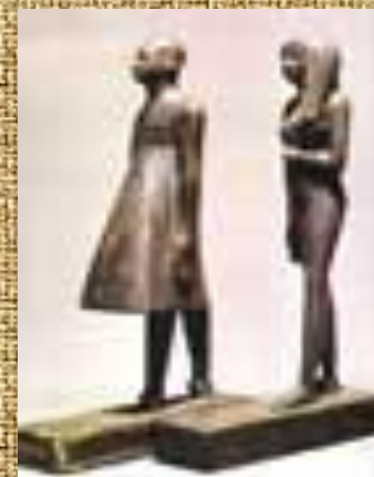
Жрець і жриця